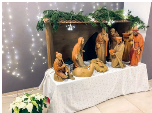
Holzkippe im Otmarzentrum