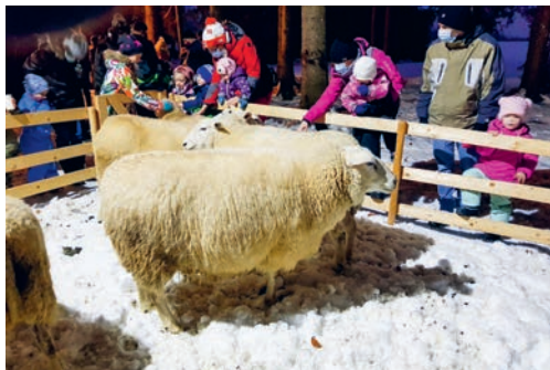
Fiire mit de Chline – Waldweihnachten