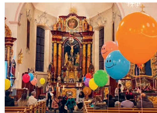
hey family Gottesdienst