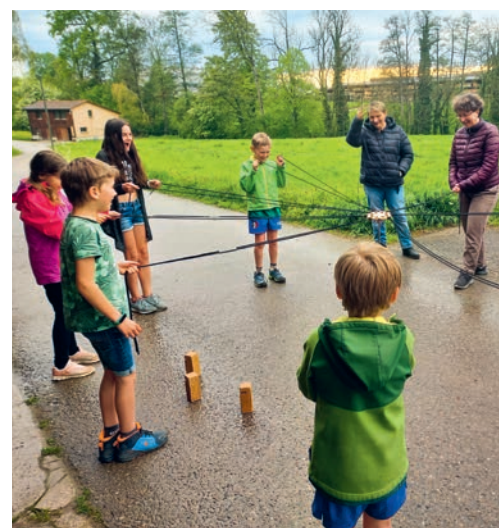
Flursegnung Egelsee mit Kindern