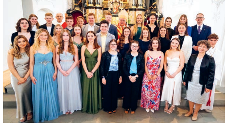
Firmung Bernhardzell und Waldkirch