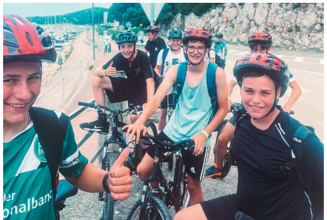
Im Jugendsommerlager gibt es ein abwechslungsreiches Programm

Das Leitungsteam freut sich auf zahlreiche Anmeldungen und eine unvergessliche Lagerwoche.