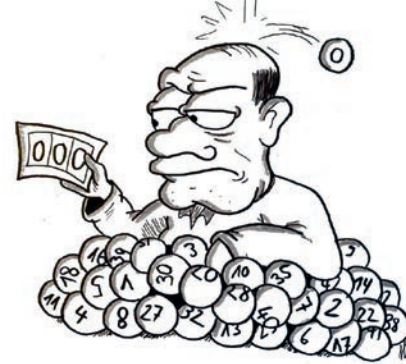
Illustration: Thomas Hättenschwiler